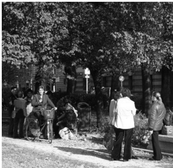
Foto 1. Parco Falcone e Borsellino, lungo Via dei Mille, luogo d'incontro, di scambio e di ricerca di lavoro per le cittadine dell'Est.

cazione dell'alloggio. Spesso si uniscono due o tre connazionali e insieme affittano un appartamento in una zona di Brescia ad alta presenza di servizi e mezzi pubblici. Questo tipo di affrancamento è la conseguenza di una maggiore esperienza di vita nel capoluogo e di una cultura di base che già le vede abituate a muoversi in spazi urbani strutturati. Una volta ottenuto il riconoscimento legale e raggiunta una condizione economica relativamente stabile, tendono a riprodurre un percorso abitativo simile ai bresciani.