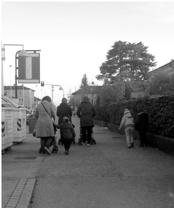
Foto 2. Zona Sanpolino, mamme straniere che rientrano a casa con i figli appena usciti da scuola.

(nuovo comprensorio di edilizia residenziale), dove si sta concretando un progetto di stabilizzazione dei migranti sul territorio e nel quale il capofamiglia, adeguatamente assistito, avvia un processo di ricongiungimento e legalizzazione della presenza della famiglia.