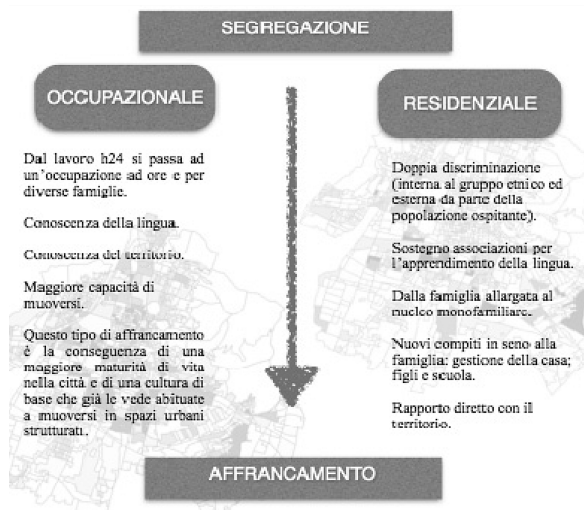
Fig. 2. Dalla segregazione all'affrancamento.

Il nodo dell'affrancamento delle donne straniere è rappresentato, in definitiva, dall'isolamento sociale: si tratta per le donne di poter perseguire gli scopi della scelta migratoria conquistando uno spazio soddisfacente di vita nel contesto dell'abitazione (Colombo M., 2012).