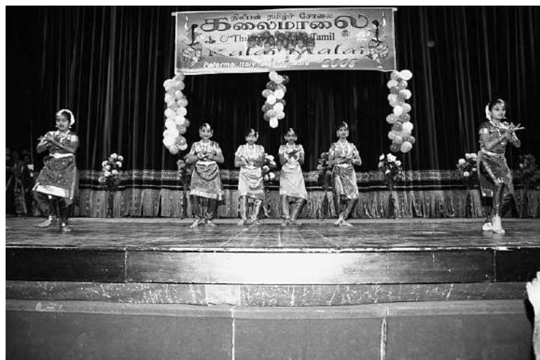
Foto 1. La comunità Tamil è molto attiva a Palermo e organizza spesso delle manifestazioni per rendersi visibile e far conoscere la cultura Tamil e le relative problematiche. La foto fa riferimento ad uno spettacolo della scuola Tamil "Thilepan" presentato al Teatro Politeama di Palermo.

La comunità Tamil presente a Palermo è la più numerosa d'Italia ed è molto attiva dal punto di vista della diffusione delle proprie ragioni contro quelle del governo singalese. La popolazione srilankese, costituita quasi in toto da Tamil, è la prima nel capoluogo di regione, almeno fin dal 2003, seguita da quella del Bangladesh e poi da quella rumena. I dati demografici a disposizione mettono in evidenza che dal 2003 al 2006 a Palermo non vi è stato un aumento significativo nella consistenza numerica dei residenti srilankesi. Addirittura nel 2006 vi è stata una diminuzione, che invece non è stata registrata a Catania. Molto probabilmente si tratta di un fenomeno di ritorno temporaneo nel paese di origine dovuto agli ef-