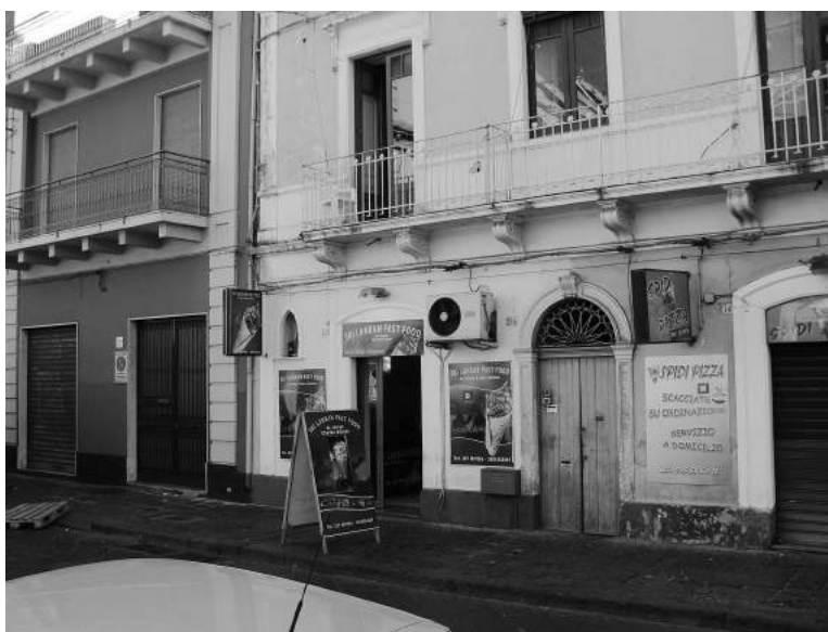
Foto 2. Lo Sri Lankan Fast Food sfida la catena locale Spidi Pizza in via Francesco Crispi, nel Centro Storico della Città di Catania.