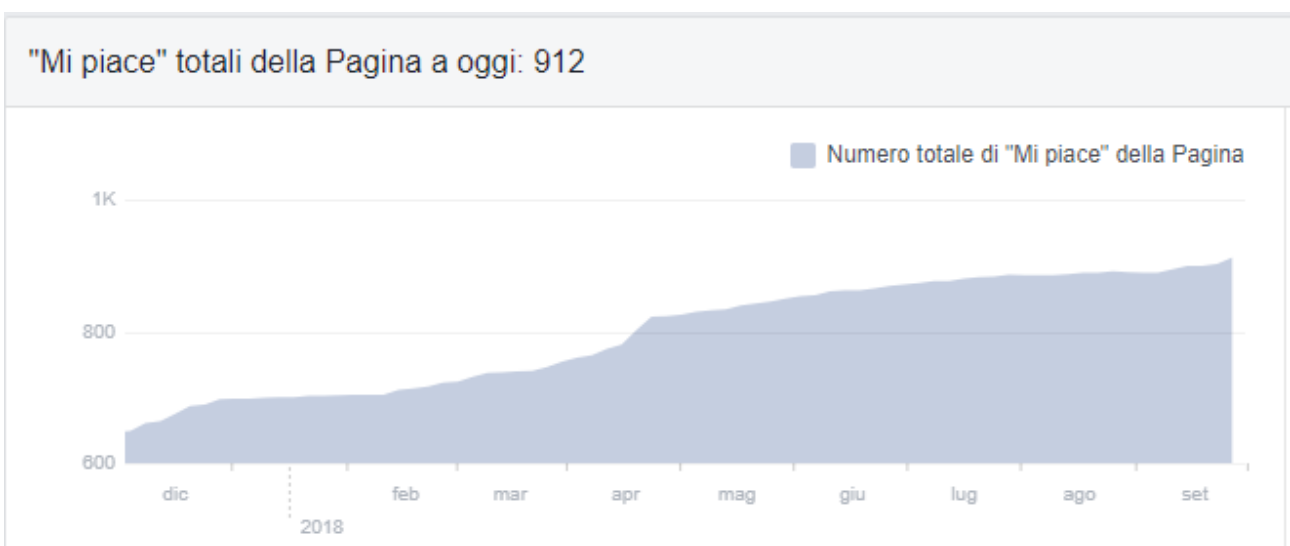
Fig. 2b - Risultati ottenuti dalla pagina Facebook dell'AGI.

Da quando il nuovo sito è stato attivato il misuratore di google dà 47.698 pagine viste con 11.618 utenti. La media giornaliera di utenti è di 120 circa (il lunedì, giorno della newsletter, sono circa il doppio).