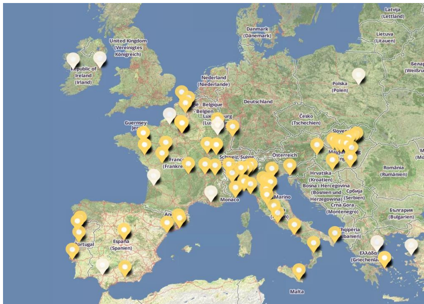
Fig. 3 – Il ruolo svolto dall'Italia nella “Notte Europea della Geografia” (6 aprile 2018).

Sul fronte della comunicazione esterna la nuova organizzazione si è rivelata subito utilissima, basti citare i risultati ottenuti (anche in stretta cooperazione con gli altri sodalizi geografici italiani e molti atenei) nel corso dell'organizzazione in 22 città, con 37 eventi, della prima edizione italiana della “Notte Europea della Geografia” (v. fig. 3). Essa ha prodotto positive ricadute per la geografia italiana a livello europeo (l'Italia ha organizzato il maggior numero di eventi apprezzati anche a livello internazionale), una più che soddisfacente partecipazione popolare ed evidenti risultati mediatici a livello nazionale e locale (televisione, radio, carta stampata, ecc.), utili per una migliore percezione del “mestiere” del geografo in Italia.