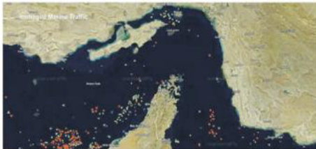
HORMUZ Crisi energetica a causa della chiusura al traffico marittimo dello Stretto nel Golfo Persico

«Certamente le imprese italiane devono diversificare fonti di approvvigionamento, non solo rotte, usare di più contratti di medio-lungo termine e partnership lungo la filiera per condividere il rischio e migliorare in chiave di "regionalizzazione intelligente" delle catene del valore, mantenendo il respiro globale ma con meno dipendenza da pochi chokepoints».